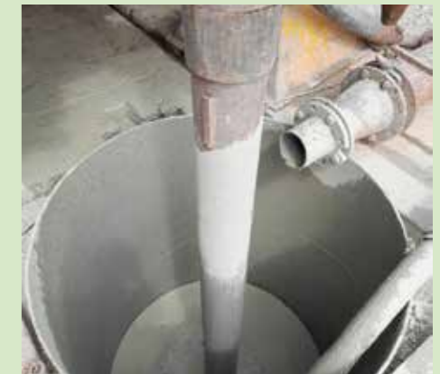
Bohrloch mit Spülung.