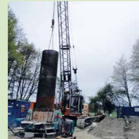
Einbau Stützrohre durch Seilbagger.