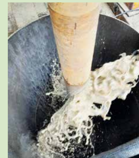
Blick ins Bohrloch während der Bohrarbeiten.