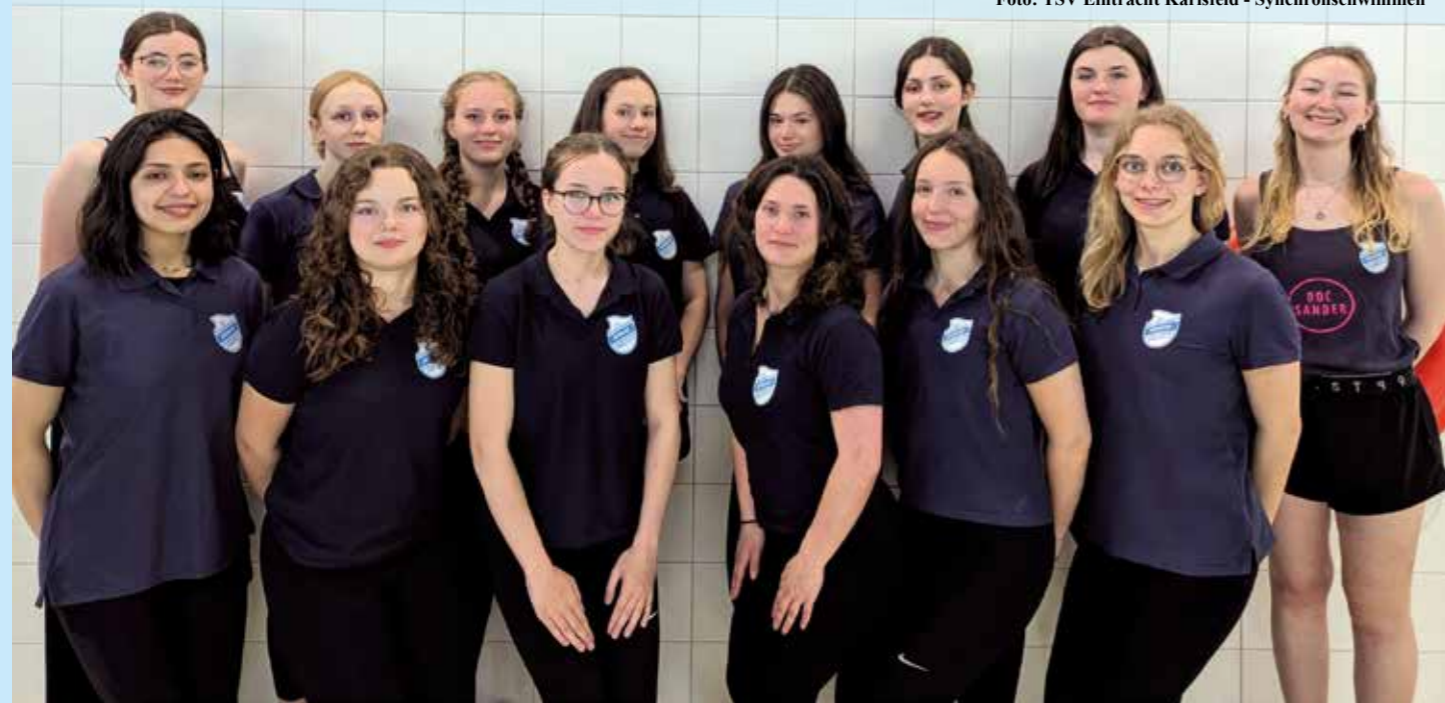
Synchronschwimmen