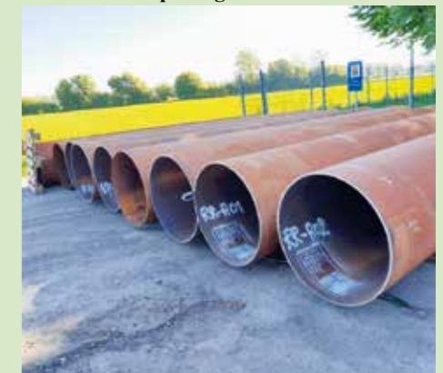
Sperrrohre, Durchmesser 1200 mm.