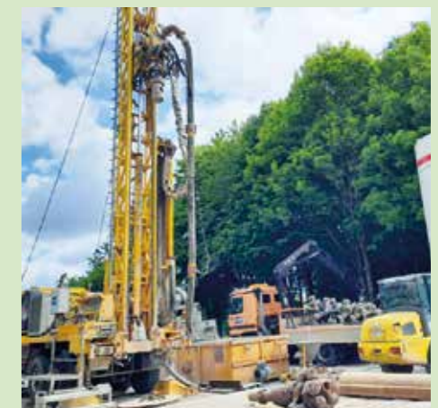
Blick auf die Baustelle.