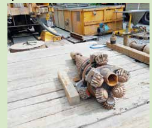
Ein weiterer Rollmeißel (zweistufig).