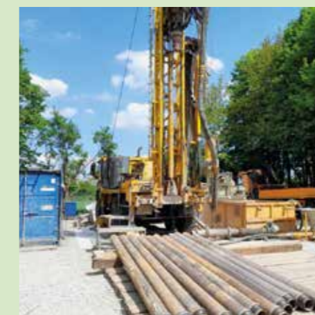
Bohrgerät mit Bohrgestänge.