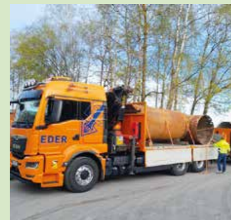
Antransport der Stützrohre mit einem Durchmesser von 1400 mm.