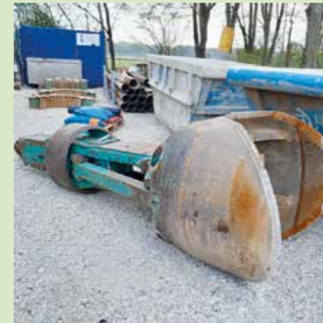
Bagerschaufel für Seilbagger.

der Ausbau rund um dieses Rohr, bevor dann Pumpversuche durchgeführt und die Pumpe eingebaut werden. Zu diesem Zeitpunkt wird das Wasserwerk einen „Tag der offenen Tür“ veranstalten, um diese seltenen Arbeiten der Öffentlichkeit vorstellen zu können. Vermutlich wird dies Mitte bis Ende September stattfinden.