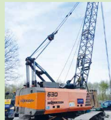
Ein Seilbagger wird benötigt, um das Bohrloch bis Ende Sperrrohrtiefe (ca. 35 m) auszubaggern und Stützrohre einzubauen.