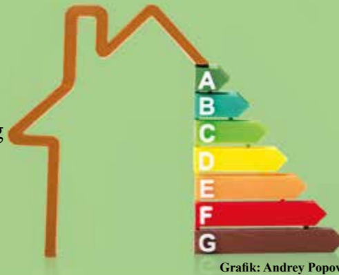
Grafik: Andrey Popov