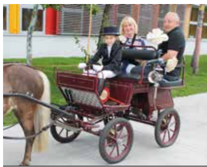
15 | „Auf Wiedersehen, es war schön!“

Abschlussfeier der FOS4 Karlsfeld . . . . . Seite 16