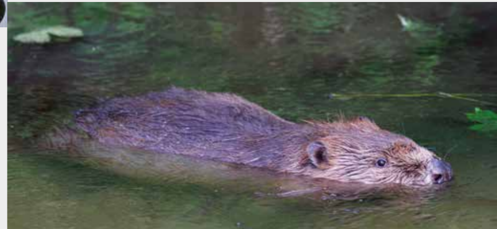
Text/Foto: Michael Matziol

laute Spaziergänger die Biber doch vertrieben haben. Man hat momentan gute Chancen, die Biber sehr früh am Morgen bis etwa 7 Uhr zu sehen oder am frühen Abend ab etwa 20 Uhr, wenn man die Augen offenhält und leise ist“.